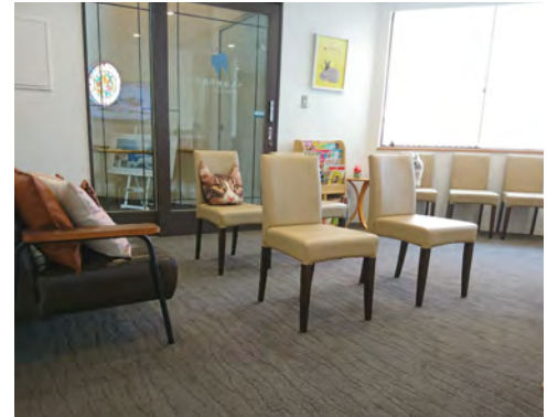
ゆったり離れてくつろいで(^^♪

また、 待合室も広め に設定しておりますので、なるべく3密にならない様をお願い致します。