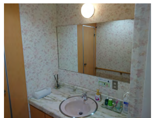
うがい薬や紙コップ、消毒液を用意しております(*ω*)

そして、感染予防にはまず 手洗い・うがい ですので、レストルームにて、手洗い、うがい、手指消毒をお願い出来れば幸いです。